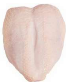
PEITO COM OSSO