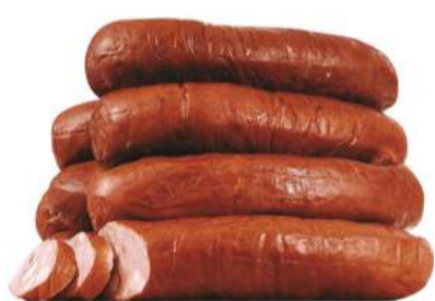
LINGUIÇA DEFUMADA CALABRESA