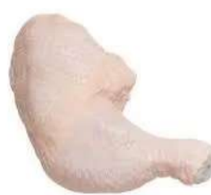
COXA COM SOBRECOXA