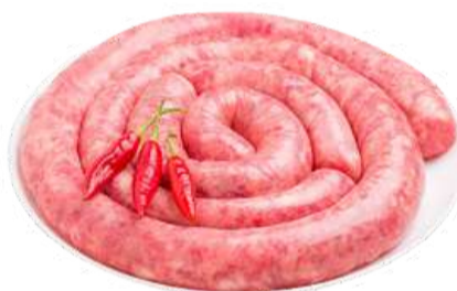
LINGUIÇA DE PORCO GROSSA APIMENTADA