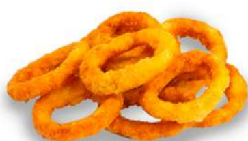
ANEL DE CEBOLA