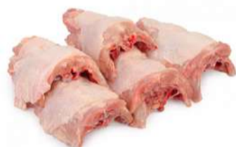
DORSO DE FRANGO