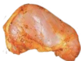
FRANGO À PASSARINHO