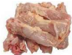
PESCOÇO DE FRANGO