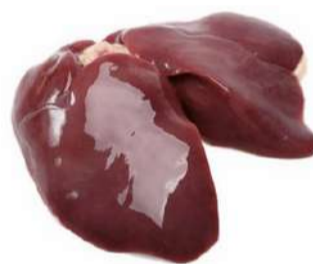
FÍGADO DE FRANGO