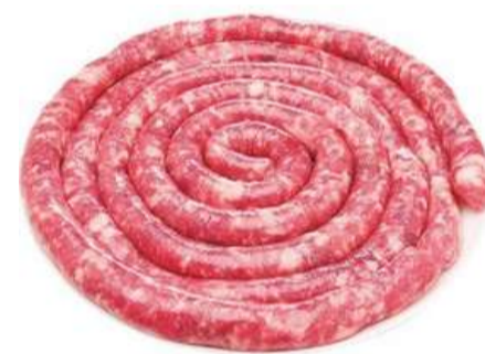
LINGUIÇA DE PORCO FINA APIMENTADA