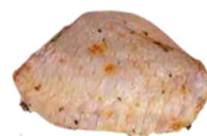
MEIO DA ASA