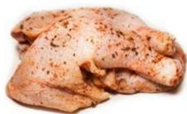
COXA COM SOBRECOXA

Ideais para uma variedade de pratos. Já vêm temperados, o que significa que você pode economizar tempo na preparação e garantir um sabor delicioso!