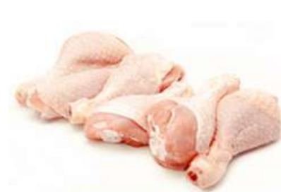
COXINHA DA ASA