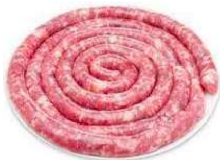
LINGUIÇA DE PORCO FINA