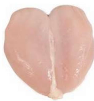
PEITO SEM OSSO