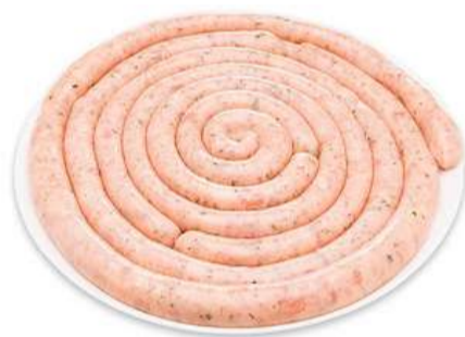
LINGUIÇA DE FRANGO FINA

Produtos pré-prontos. Facilidade e economia no seu dia-a-dia. As melhores opções para o seu negócio.