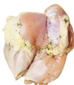
FILÉ DA COXA