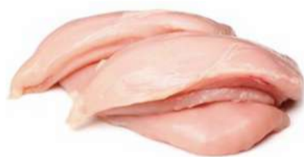
FILET DE PEITO

Pode ser consumido assado, frito ou empanado; Ideal para diversas receitas; Macio e suculento;