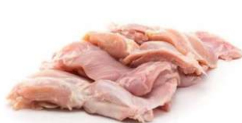
FRANGO À PASSARINHO