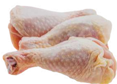
COXA DE FRANGO