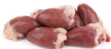
CORAÇÃO DE FRANGO

Opções para diversas receitas, além de serem uma opção econômica para aproveitar todas as partes do frango!