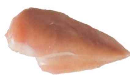
FILET DE PEITO S/SASSAMI