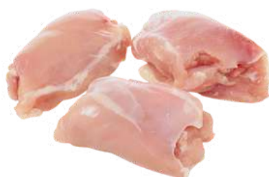
FILET DE COXA