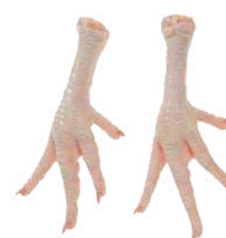
PÉ DE FRANGO