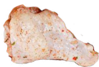
COXA DA ASA